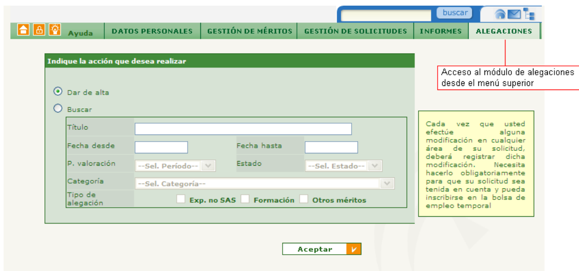
Figura 3. Pantalla principal del módulo de alegaciones.

La pantalla principal del módulo de alegaciones se muestra en la siguiente figura: