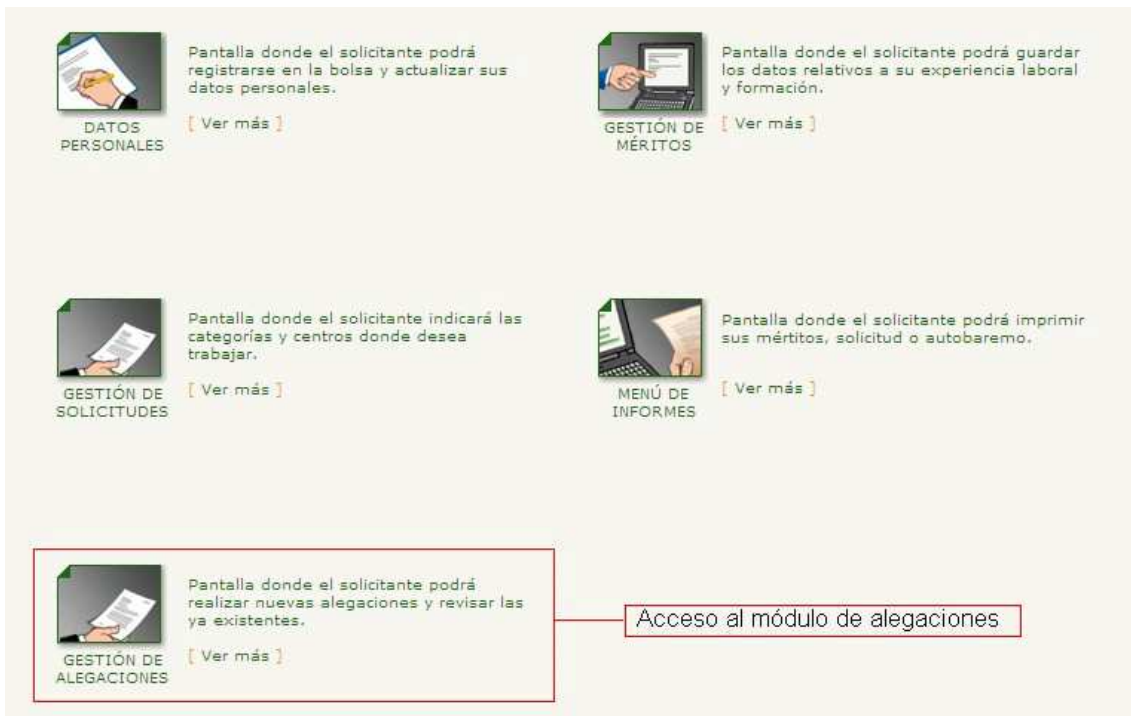
Figura 2. Pantalla menú principal de Bolsa de Empleo.