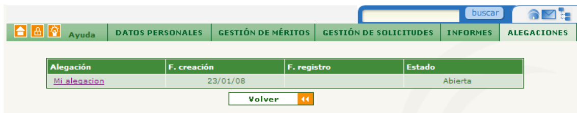
Figura 5. Pantalla de resultados de búsqueda.

Pulsando sobre el botón "aceptar" se realizará la búsqueda con los criterios establecidos y presentará una pantalla de resultados de búsqueda similar a la siguiente: