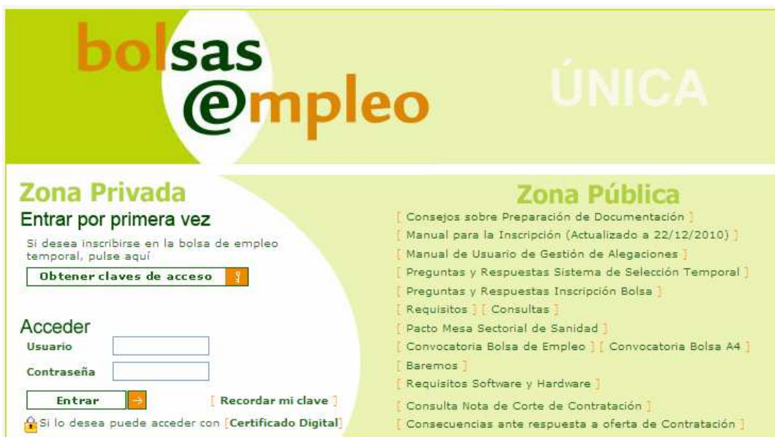
Figura 1: Pantalla de inicio del portal de Bolsa de Empleo

Tal y como se viene haciendo hasta ahora, entramos en la aplicación Web a través de la pantalla principal: