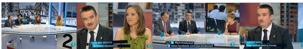
Imágenes del debate sobre los médicos internos residentes en el programa Para todos de TVE-2.

La tabla anterior hace referencia al número total de Facultativos Residentes (MIR, FIR, PIR, BIR, QIR y RDIR), que han elegido plaza y que si no han abandonado estarían en marzo de 2016 formándose en las diferentes CCAA (Servicios de Salud, Centros Privados y Escuelas). Sería necesario restar la recirculación y abandonos, muy variables por especialidad.